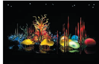
Dale Chihuly, Toyama Mille Fiori, 2015, H280xW940xD580cm, Toyama Glass Art Museum