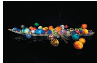
Dale Chihuly, Toyama Float Boat, 2015, H60xW917.5xD657.5cm, Toyama Glass Art Museum